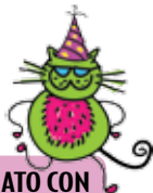
EL GATO CON SOMBRERO

Diga un verso familiar de una canción o un rimo para jugar, algo así como: “vamos a remar al mar”. Deje que su niño escoja una letra del alfabeto. Si tiene letras magnéticas pongálas en un sombrero y permita que su niño tome una. Entonces haga un rimo reemplazando la primera letra de cada palabra por la letra que su niño escogió.